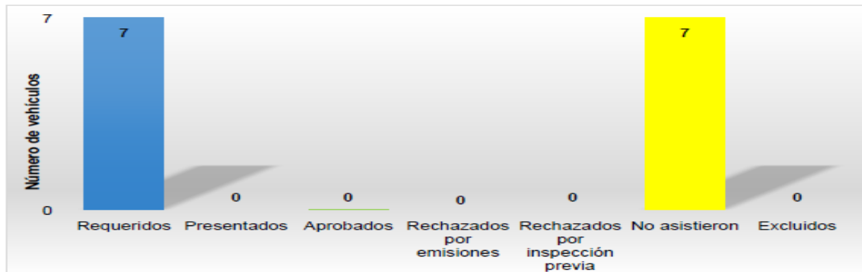
Gráfica 1. Análisis del requerimiento realizado a la empresa BIOLÓGICOS Y CONTAMINADOS S.A. E.S.P